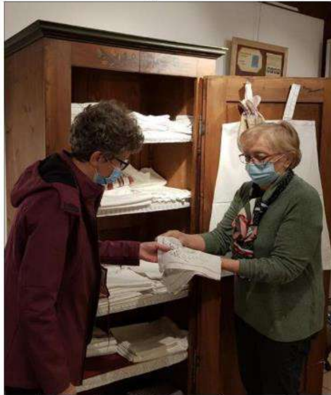
Les Amis de la Maison rurale de l'Outre-Forêt ont ressorti des collections de linge brodé et de dentelles.

Plusieurs associations de solidarité et des artistes de renom exposeront dans