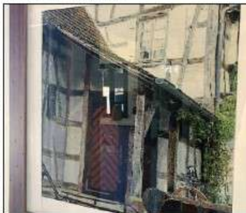
Gestochen scharf: Erst bei näherem Hinsehen wird es klar: Dies ist kein Gemälde, sondern beste Kreuzstichkunst.