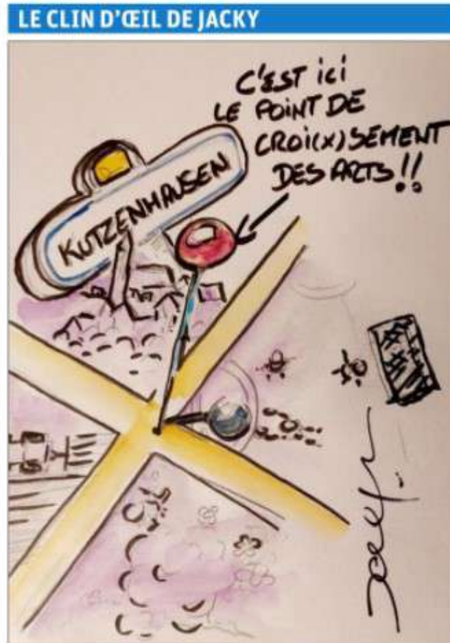
Dessin DNA/Jacky Meyer

Cette semaine, c'est la 16 e édition du festival de point de croix et de broderie de Kutzenhausen qui a inspiré notre illustrateur. Cette année, le thème est « la petite mercerie » et ce dimanche marque la clôture de l'événement.