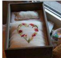
Les visiteurs ont découvert des réalisations soignées et inspirantes.