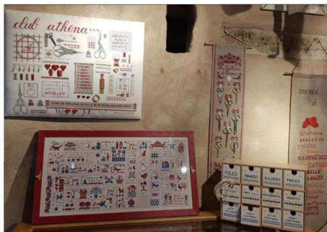
Certaines ont prêté leur boîte de rangement, d'autres ont mis en scène leur collection de ciseaux... L'imagination des brodeuses est débordante !

Débordant d'imagination, les brodeuses du club Du Fil à l'aiguille et leurs amies ont