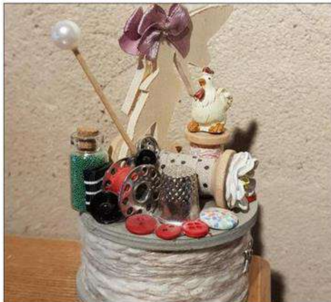
La petite mercerie, thème de cette édition, n'est pas déclinée qu'en point de croix : en voici un bel exemple artistique et original.