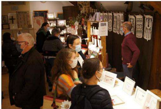
Le public et les 110 exposants se sont retrouvés après l'année blanche de 2020.

Car ce sont 110 exposants, parfois venus de loin, qui ont participé à cette édition après l'année blanche de 2020 : un plaisir, pour eux, de retrouver visiteurs et amies brodeuses. « Les gens qui viennent ici aiment l'artisanat et la création, ils sont très ouverts. Et il y a toujours beaucoup de monde,