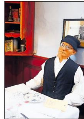
Im Sonntagsstaat: der Altbauer.

Wohnzimmer, sitzt die Bäuerin am Schreibtisch. Gar nicht so klein auch das Kinderzimmer und dann noch der Alkoven mit zwei Betten und Nachteimer für die Alten, das Schlafzimmer des jungen Bauernpaares, die Küche samt Nebenküche. Das wirkt alles doch recht gediegen. Die Möbel waren übrigens – wie auch die landwirtschaftlichen Geräte – großenteils noch vorhanden und wurden durch Spenden und Zukäufe lediglich ergänzt.