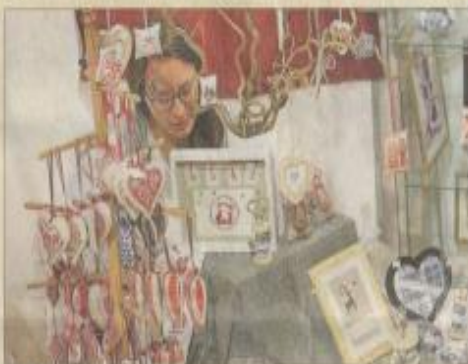
Petits ou grands ouvrages, toujours superbes.