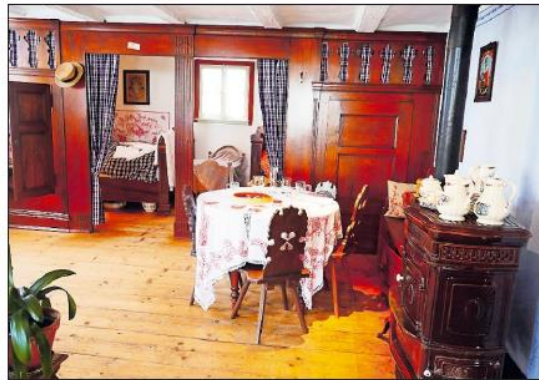
Wohnkultur das 18. Jahrhunderts, mit Alkoven: die „Großstübb“.