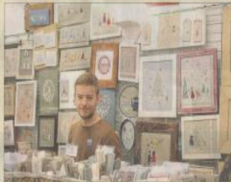
L'art n'est pas une exclusivité féminine.