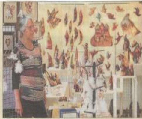
Symphonie des couleurs.