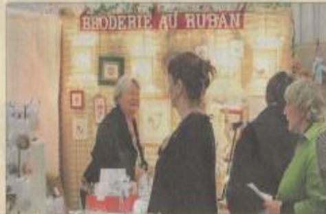
L'originalité dans de nombreux modèles.