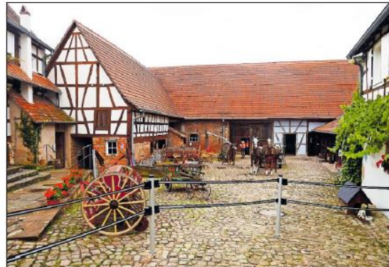
Mitten im Ort: Blick auf das Bauernhofmuseum.