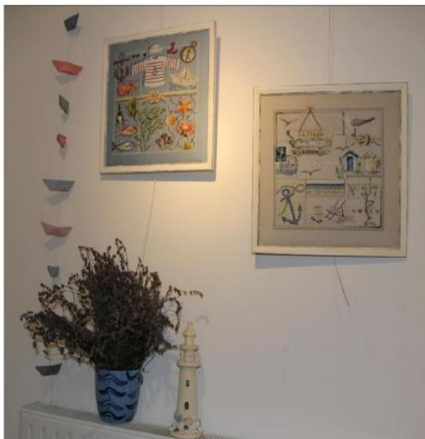
La thématique Entre mer et montagne a été déclinée dans la décoration de la Maison rurale.