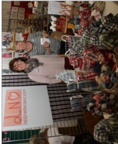
Le stand de l'association Hélène de Cœur.

Jusqu'à dimanche 27 octobre, festival Point de croix et broderie organisé par la Maison rurale de l'Outre-Forêt à Kutzenhausen.