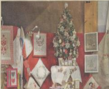
L'esprit de Noël déjà bien présent dans la manifestation.

Cette 15 e édition profita de l'été indien pour se rapprocher des records de fréquentation. Plus de 140 exposants, venus pour la plupart de fort loin (Réunion, Paris, Champagne, etc.), ont permis à des milliers de visiteurs de découvrir les subtilités régionales. Sur les différents sites de Kutzenhausen et dans les villages autour, le sourire fut sur toutes les lèvres. F.C.