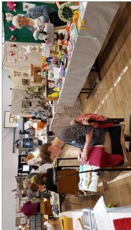
Les visiteurs peuvent prendre le temps d'échanger avec les exposants qui proposent souvent des démonstrations de leurs talents.