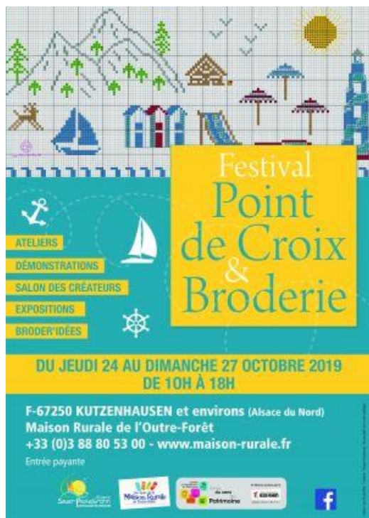
DR Festival Point de Croix et Broderie 2019

Maison Rurale de l'Outre-Forêt - Kutzenhausen _