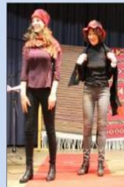
Le défilé de mode aura lieu samedi à 16 h.

Présentation des associations de broderie et de solidarité, de leurs réalisations et de leurs actions à la salle polyvalente de Kutzenhausen.